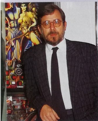
La experiencia de Cabeza de Vaca en Alemania tampoco fue demasiado exitosa. J.P. quiso exportar a Europa y los resultados fueron discretos