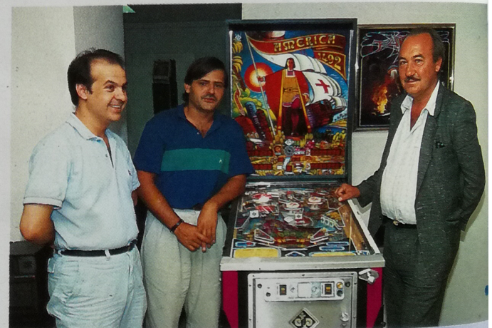
Cualquier motivo es bueno para lanzar un pinball. El quinto centenario del descubrimiento también, aunque los descubridores del pinball (Castillo, Bosch y Paredes) volvieron a fallar