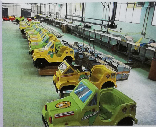
El retraso en la puesta en comercialización de los infantiles fue otra de las causas del hundimiento de J.P. Demasiada inversión y pocos resultados