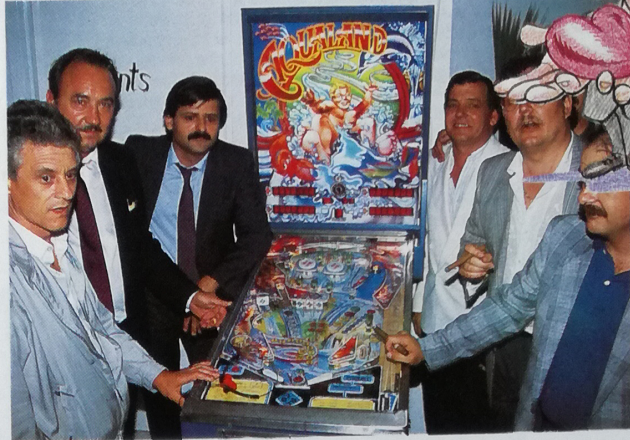
El «Aqueland» presentado con un importante esfuerzo del staff de J.P. fue un jarro de agua fría